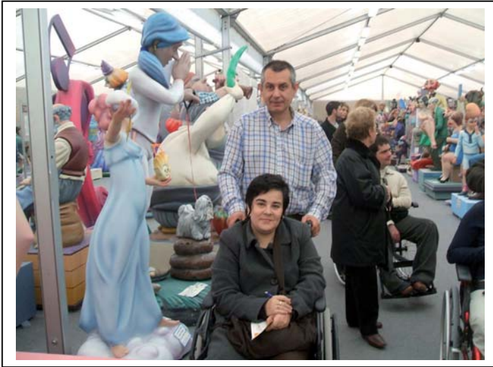
Otro momento de la visita a la Exposición del ninot