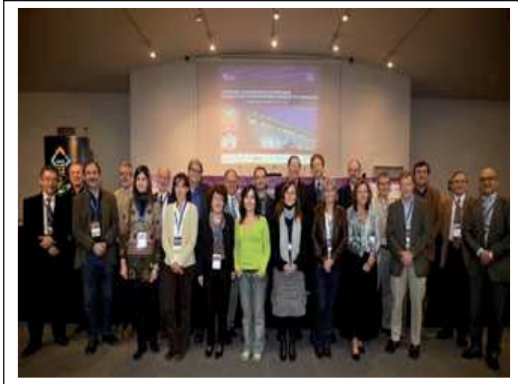
Grupo de ponentes venidos de todo el mundo

Asistencia con una mesa informativa al Simposium Internacional sobre Enfermedades Neuromusculares Raras, en el salón del Museo Príncipe Felipe en la Ciudad de la Ciencias de Valencia, organizada por la Cátedra “Santiago Grisolia”,