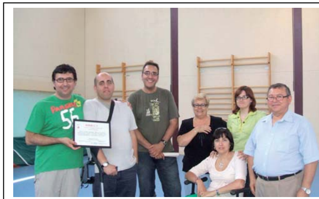
Instituto de Benasal

También a petición de la Escuela de Verano de Rafelbuñol, hemos realizado una jornada de sensibilización a la discapacidad a los participantes de la Escuela.