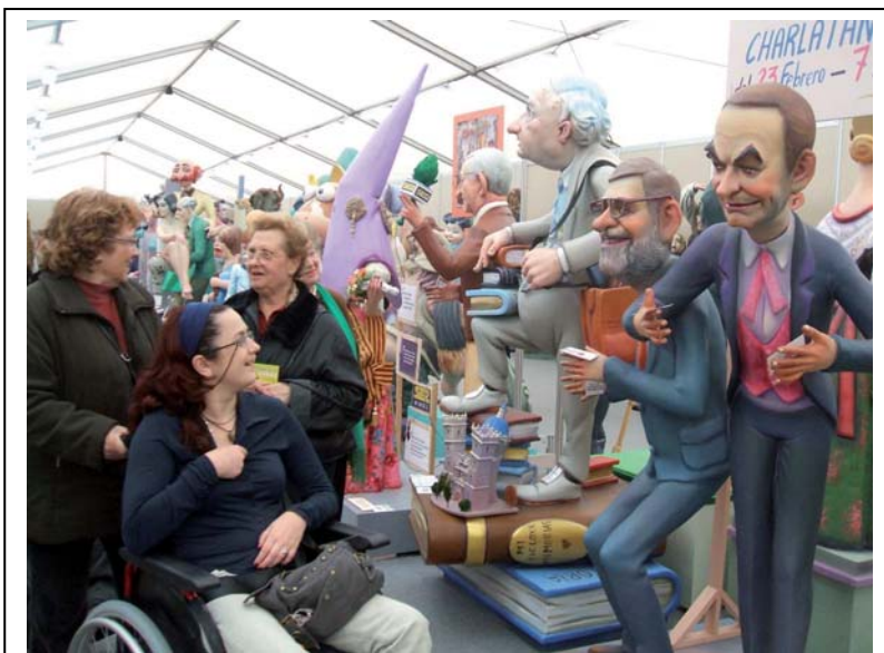
Admirando las figuras

Una de las salidas es la visita a la Exposición del Ninot , en ella cada uno vota al mejor Ninot de su gusto, y después a merendar .