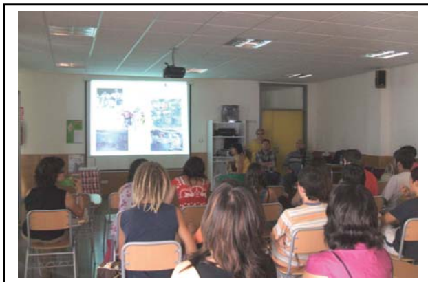
Instituto de Benaguacil

Este año 2008, se ha realizado en Alicante: Instituto de Secundaria de Cocentaina , en Castellón: Instituto de Benasal , y en Valencia: Instituto de Benaguacil .