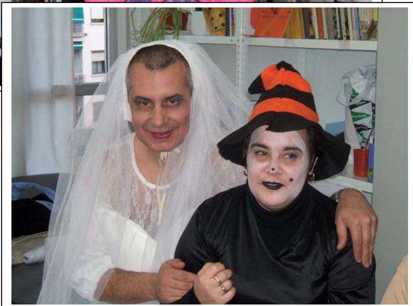
Ella brujiita y el de Novia