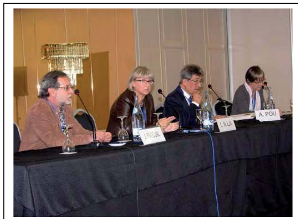
XXV congreso ASEM Barcelona

Federaciones de Valencia, Castellón y Alicante, en las actividades de FEDASEM, y en las de FEDER.