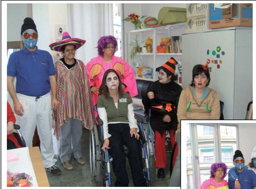
Bailando y merendando.

Una fiesta que gusta mucho por lo bien que lo pasamos tanto mientras nos disfrazamos como después.