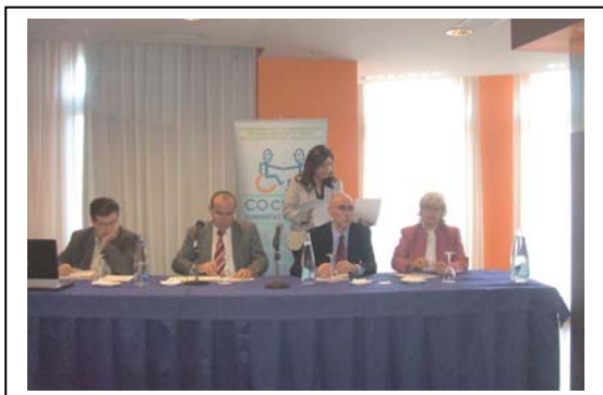
Convenció dirigents Cocemfe cv

ASEM CV, participa en las actividades que realizan las federaciones a las que pertenece, como es, la Confederación de Cocemfe Comunidad Valenciana, en sus